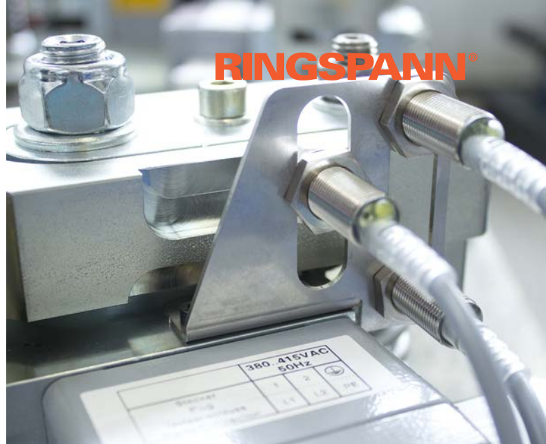
Das Monitoring der elektrischen Bremsen von RINGSPANN erfasst die Zustandsabfrage.